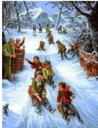
Iarna pe uliță